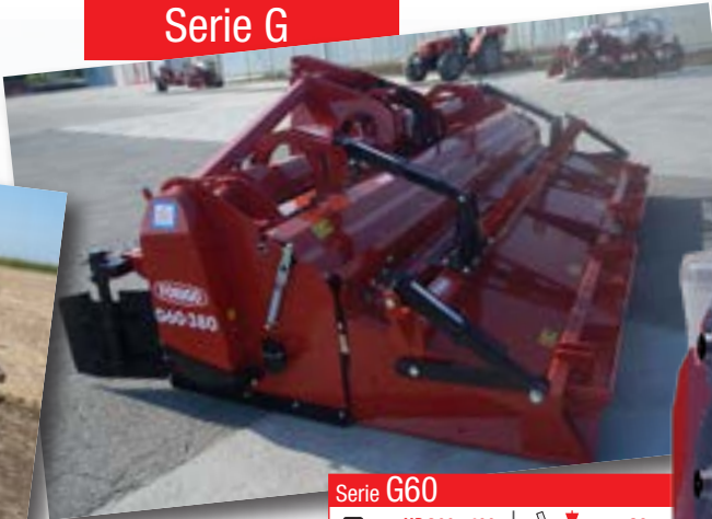
Serie G60 HP 200÷400 kW 148÷295 cm 28 inch 11