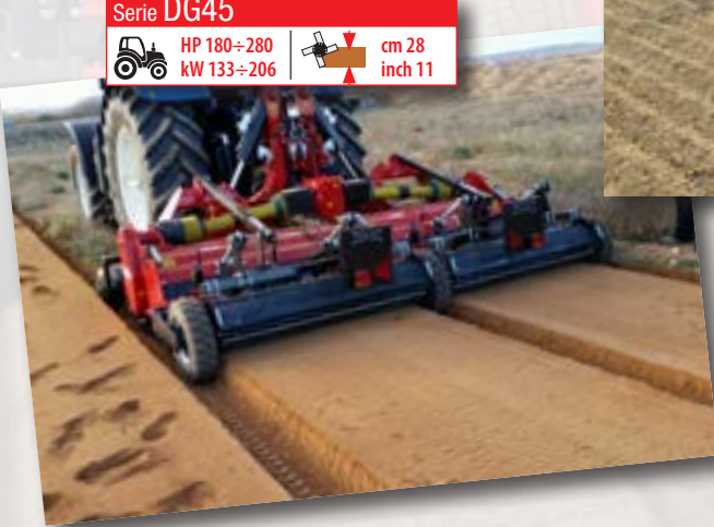
Serie DG45 HP 180÷280 kW 133÷206 cm 28 inch 11