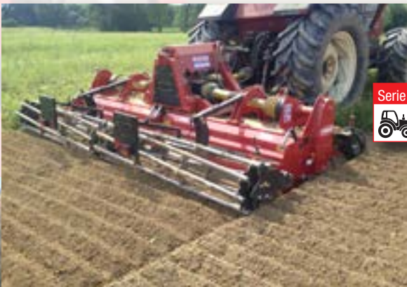
Serie DG35 HP 120÷200 kW 89÷148 cm 25 inch 10