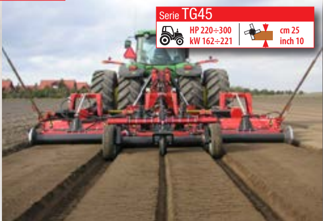
Serie TG45 HP 220÷300 kW 162÷221 cm 25 inch 10