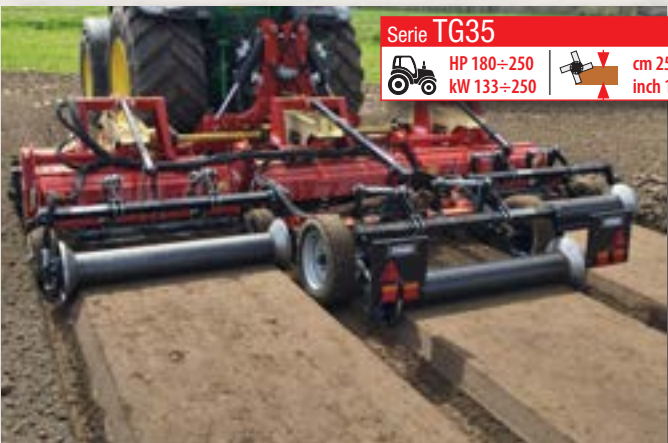
Serie TG35 HP 180÷250 kW 133÷250 cm 25 inch 10