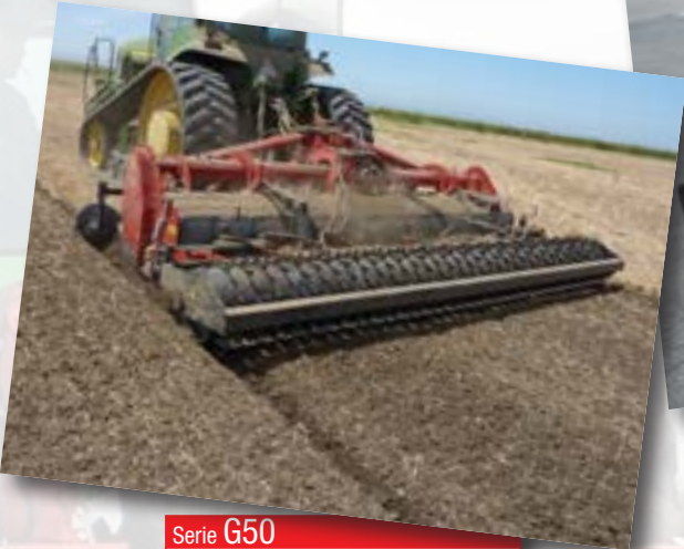
Serie G50 HP 150÷300 kW 111÷221 cm 28 inch 11

Trasmisie cu 6 angranaje Transmission driven by 6 gears