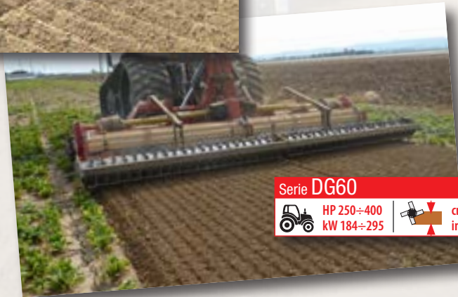
Serie DG60 HP 250÷400 kW 184÷295 cm 30 inch 12