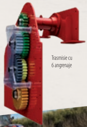
Trasmisie cu 6 angrenaje