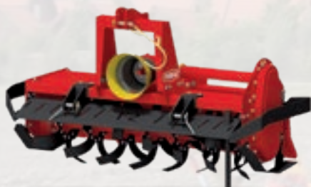
Serie F2 HP 30÷55 | cm 18 kW 23÷41 | inch 7