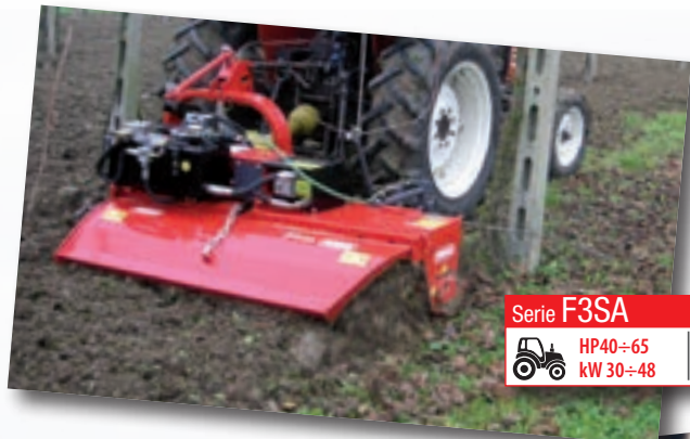
Serie F3SA HP40÷65 kW 30÷48 | cm 22 inch 9