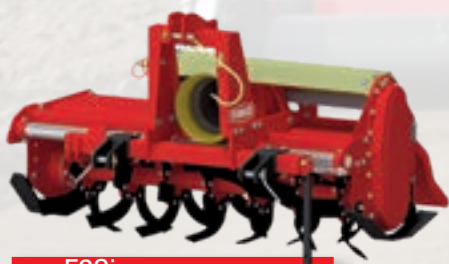
Serie F2Si HP 30÷55 | cm 18 kW 23÷41 | inch 7