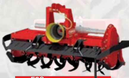
Serie F2S HP 30÷55 | cm 18 kW 23÷41 | inch 7