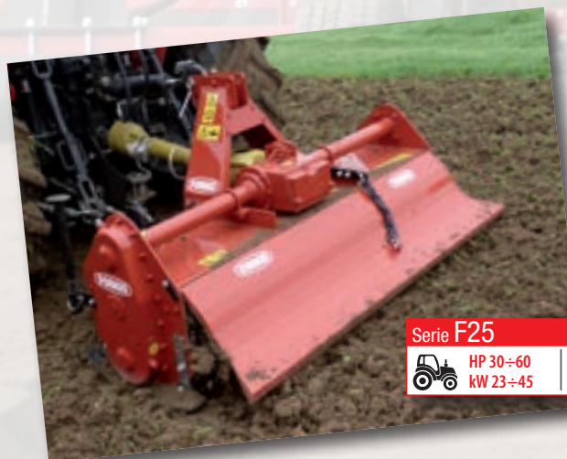
Serie F25 HP 30÷60 | cm 18 kW 23÷45 | inch 7