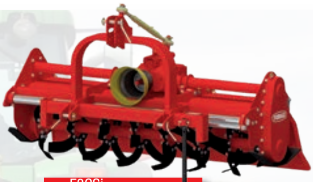
Serie F3CSI HP40÷65 kW 30÷48 | cm 22 inch 9