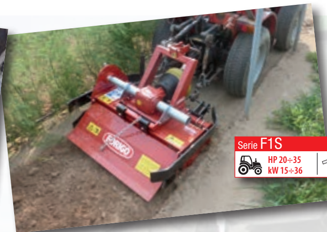
Serie F1S HP 20÷35 | cm 15 kW 15÷36 | inch 6