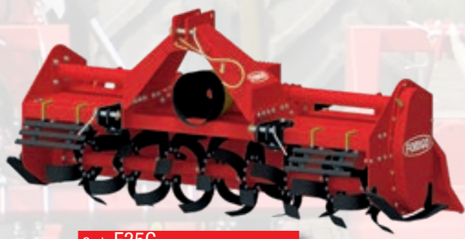
Serie F35C HP60÷85 kW 45÷63 | cm 25 inch 10