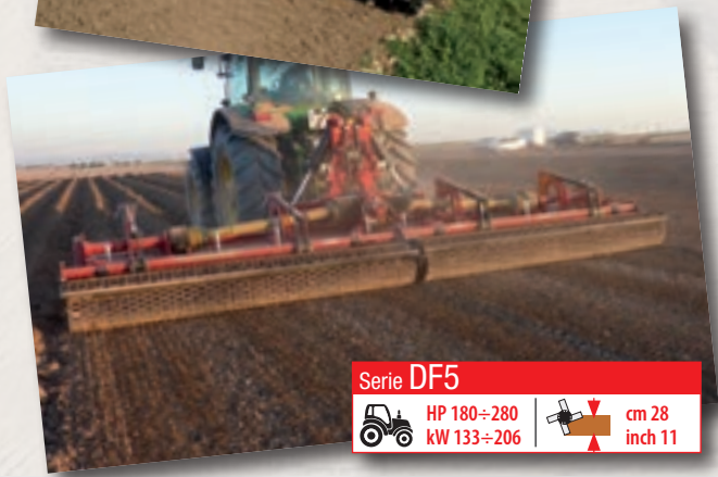
Serie DF5 HP 180÷280 kW 133÷206 | cm 28 inch 11