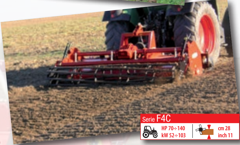
Serie F4C HP 70÷140 kW 52÷103 | cm 28 inch 11