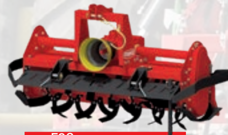
Serie F2C HP 30÷55 | cm 18 kW 23÷41 | inch 7