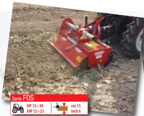
Serie F0S HP 15÷30 | cm 15 kW 12÷23 | inch 6