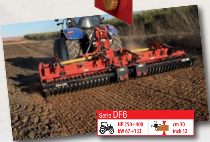
Serie DF6 HP 250÷400 kW 67÷133 | cm 30 inch 12