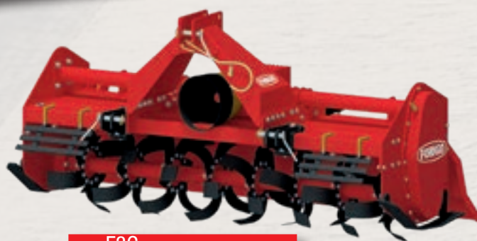
Serie F3C HP 40÷65 | cm 22 kW 30÷48 | inch 9