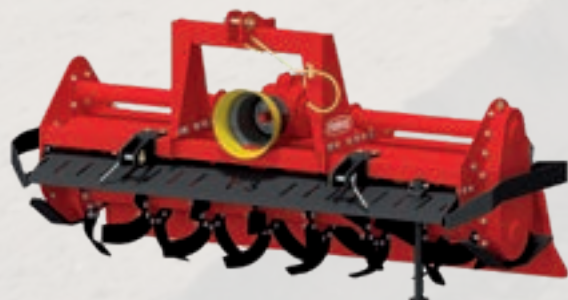
Serie F3 HP 40÷65 | cm 22 kW 30÷48 | inch 9